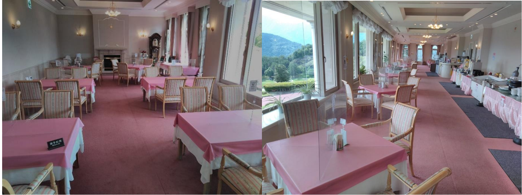
テーブル使用後都度消毒作業を実施