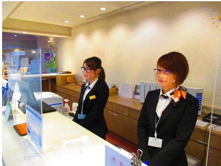
フロントのアクリルパーテーション