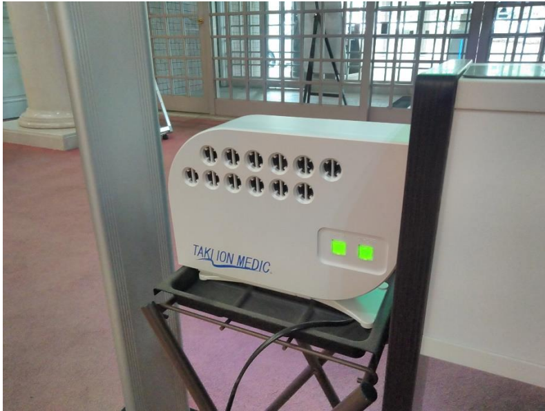
入口にイオン発生器を設置