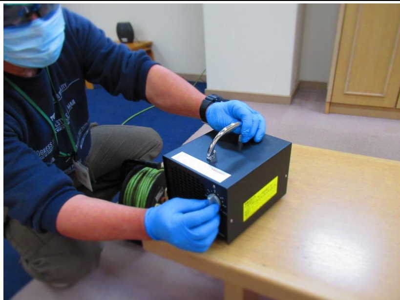
業務用オゾン発生器を使用して定期的な館内の殺菌作業