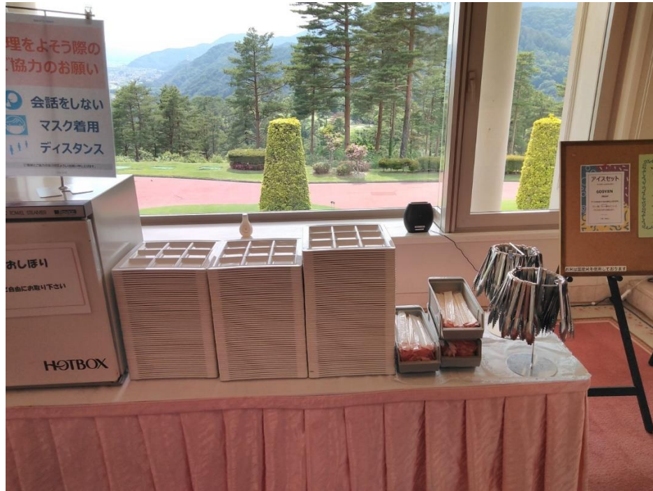
トレイの受け取り場所にて個別のトングを用意