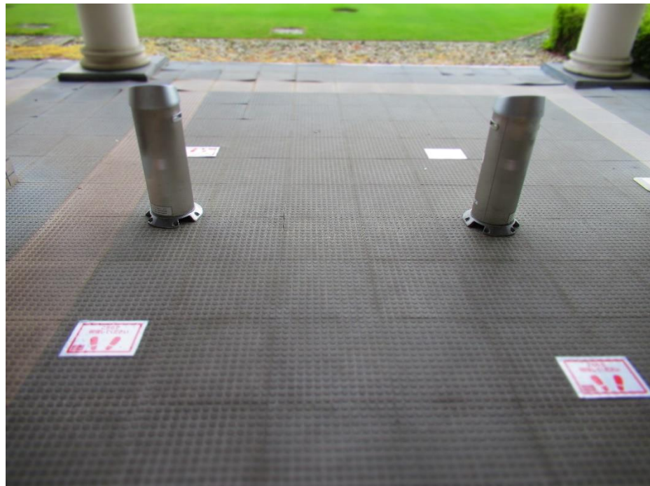
喫煙コーナーのソーシャルディスタンス