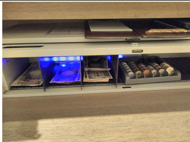
現金の UV 殺菌器